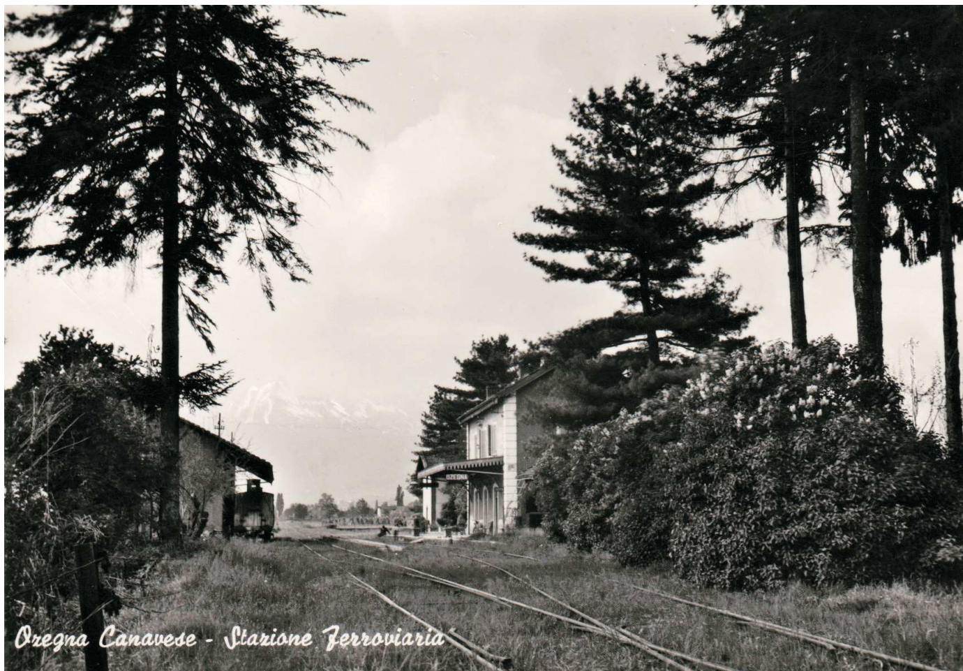
Ozegna Canavese - Stazione Ferroviaria